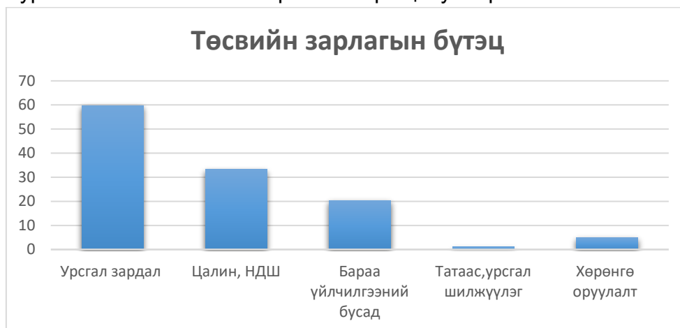
Зураг №3. Төсвийн зарлагын бүтэц /хувиар/