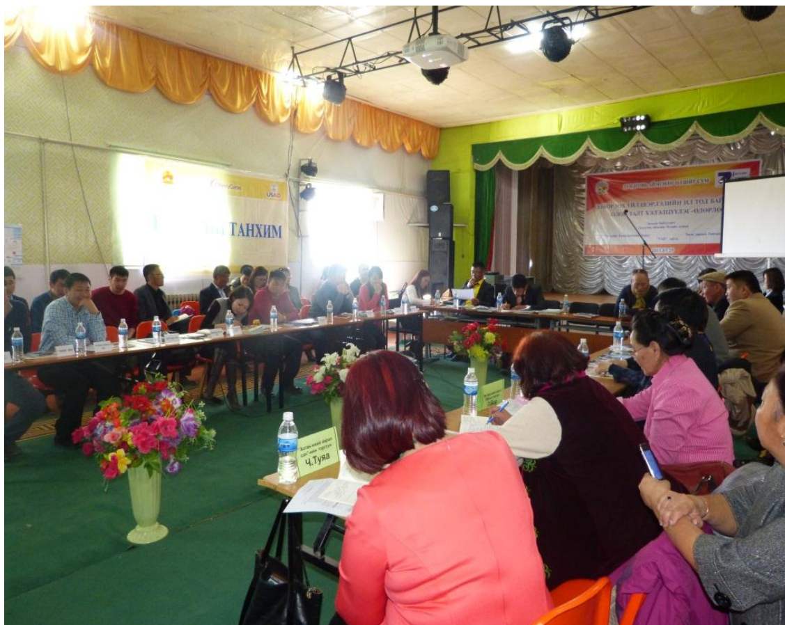
“Олборлох үйлдвэрлэлийн ил тод байдал” олон талт хэлэлцүүлэг

Монгол улсын хууль, аймаг, сумын ИТХ-аас гарсан тогтоол, шийдвэрийг 6 БИНХ, мэдээллийн цагаар иргэдэд яриа, таниулга хэлбэрээр хийсэн. Төрийн мэдээлэл, Нутгийн удирдлага, Нигүүлсэл сэтгүүл, аймгийн сонин захиалж иргэний танхимаар үйлчилсэн. ИТХ, Тэргүүлэгчдээс гарсан шийдвэр, цаг үеийн ажлыг мэдээллийн самбараар ил тод тогтмол мэдээлж, сумын сонин Хурал.mn сайтад зарим мэдээг тавьсан. ИТХ-ын тэргүүлэгчид, ажлын албанаас 2015 онд гаргасан тогтоол, шийдвэр, авч хэрэгжүүлсэн арга хэмжээг ЗДТГ-тай хамтран гарын авлага бэлтгэж сумын нийт айл, өрхүүдэд хүргүүлж сурталчилсан. Аймагт болсон “НӨУЁБ-ын чадавхыг бэхжүүлэх нь” төслийн хүрээнд “Төлөөлөгчдийн манлайлал” сургалтанд Тэргүүлэгчид, нарийн бичгийн дарга хамрагдсан. Шинэ үндсэн хууль батлагдсаны 23 жилийн ойгоор уламжлал ёсоор төрийн далбаа залах ёслол үйлдэж, ЕБС-ийн сурагчид иргэний андгай өргөсөн. Энэ үеэр хүүхэд, насанд хүрэгчдийн дунд шатрын тэмцээн, нийт иргэдийн дунд үндсэн хуулийн сэдвээр “Центавр” тэмцээн явууллаа. Иргэний танхимаас уламжлалын дагуу уул уурхайн сэдэвт 3 талт хэлэлцүүлэгийг зохион байгуулав. Хэлэлцүүлгийн онцлог нь хэлэлцүүлэгт аймгийн ЗДТГ, УБ хотын 7 ТББ, Баянжаргалан, Говь-Угтаал, Гурвансайхан сумдын төлөөлөл, удирдлагууд оролцож цар хүрээгээ тэлж, ач холбогдол өндөр байлаа.