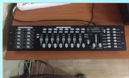
Пед гэрэл, Гэрлийн пульт, Холбогч утас, Микрафоны утас, Алсын микрафон, Микрафоны хөл, Дифуэр холбогч зэргийг 2.714.000 төгрөг