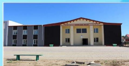
Соёлын төвийн гаднах засварын ажил 38,5 сая төгрөг