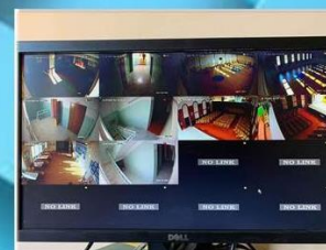
Камержуулалт 6.000.000 төгрөг