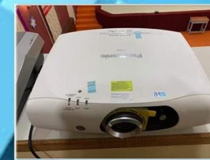
Мини кино театрын тоног төхөөрөмж 46.500.000 төгрөг