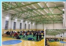
Спорт заалны их засвар 153.000.000 төгрөг