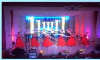
Бүжигчдийн хувиас 2.405.700 төгрөг