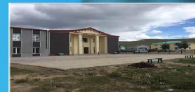
Гаднах талбайн явган зам 12.000.000 төгрөг