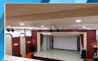
Тайзны хөшиг 406.500 төгрөг