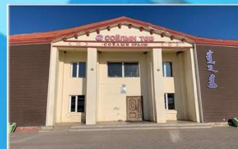
Гэрэлтүүлэгтэй хаяг 2.400.000 төгрөг