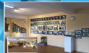
Номын сангийн уншлагын заалны тохижилтонд 1.5 сая төгрөг