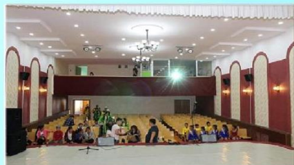
Соёлын төвийн доторхи засвар 96.8 сая

Соёлын төвийн барилгын засвар. Засварын ажлын төсөв 135,650,000 төгрөг Орон нутгийн төсвийн хөрөнгө оруулалтаар