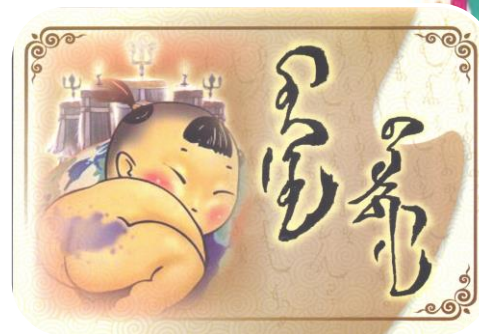
Ёс суртахууны боловсрол