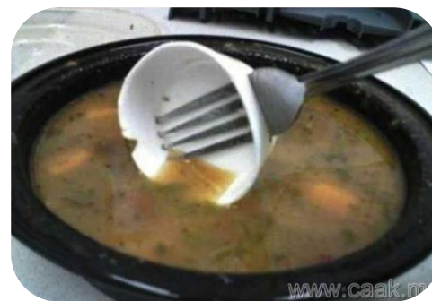
Амьдрах ухааны боловсрол