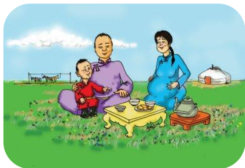
Гэр бүлийн боловсрол