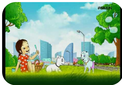
Гоо зүйн боловсрол