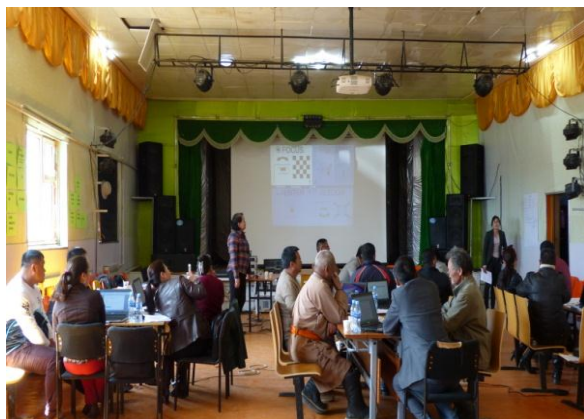
Төлөвлөгөө боловсруулж, бүлгүүдээс Төлөвлөгөө боловсруулсан

хангах дунд хугацааны хөтөлбөрийг анх удаа гаргалаа. Хөтөлбөрийг боловсруулахад “Хил хязгааргүй алхам” ТББ, сумын ажлын хэсэг, иргэдийн төлөөлөл, Хулд, Луус сумдын төлөөлөл оролцсон.