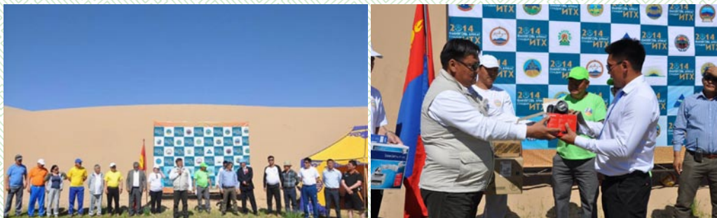
Нэгдсэн арга хэмжээ, компьютер техник хэрэгсэл гардуулав. Сэврэй-2014 он

Сэврэй сумын нэгдсэн арга хэмжээний үеэр сумдын ИТХ-ын Тэргүүлэгчдийн ажлын албаны ажиллах орчин нөхцлийг сайжруулах, үйл ажиллагааг төлөвшүүлэх зорилгоор 80 сая төгрөгний тендер зарлаж, сум бүрт компьютер, принтер, проектор, сканер, канон, зургийн аппарат, дуу хураагуур /диктафон/ зэрэг шаардлагатай тоног төхөөрөмжийг хувиарлан олголоо.