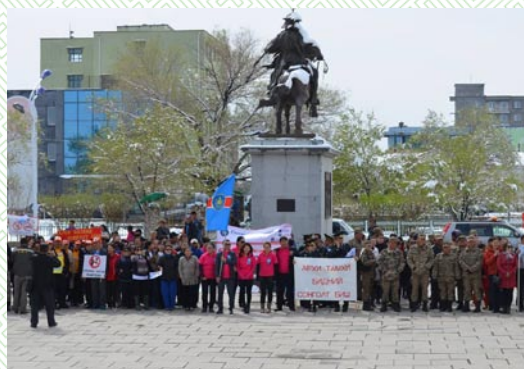
Архигүй-Өмнөговь хөтөлбөрийн нээлт-2014 он

Тус хөтөлбөрийг сумдад хэрэгжүүлэн ажиллах салбар зөвлөлийг байгуулан, АА цуглааны үйл ажиллагааг дэмжиж үйл ажиллагааг нь тогтмолжуулан “Говийн наран” бүлгийн 1 жилийн ойн арга хэмжээг зохион байгуулж ажилласаны үр дүнд 26 иргэнийг архидан согтуурах хорт зуршлаас нь салгаж, эрүүл зөв амьдралд татан оруулсан байна.