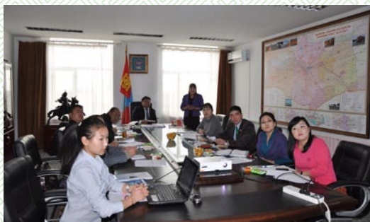
Улаан загалмайн хорооны удирдах зөвлөлийн хурал

ИТХ-ын даргын хариуцан ажиллаж, Тэргүүлдэг байгууллагын нэг нь Улаан загалмайн хорооны үйл ажиллагаа байдаг.