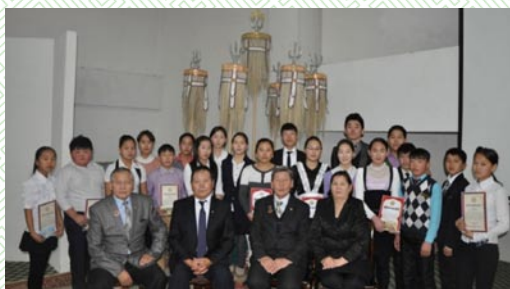
“Үндсэн хуулийг хэн сайн мэдэх вэ” сэдэвт илтгэл, эссэ бичлэгийн уралдаан