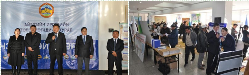
Аймаг, сумдын Иргэдийн Төлөөлөгчдийн Хурлын нээлттэй өдөрлөг 2013 он

Аймгийн ИТХ-ын Тэргүүлэгчид, ажлын албаны “Нээлттэй өдөрлөг”-ийг анх удаа аймаг, сумдын Иргэдийн Төлөөлөгчдийн хурлыг хамруулан зохион байгуулж, тогтоол шийдвэр, үйл ажиллагаагаа олон нийтэд нээлттэй мэдээллэн, сумдын ИТХ-ыг туршлага судлах боломжоор хангалаа.