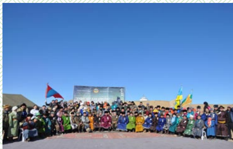
Батмөнх даян сэцэн хаан Батмөнх даян сэцэн хааны хүй цөглөсөн газар Хүрмэн сумын нутаг