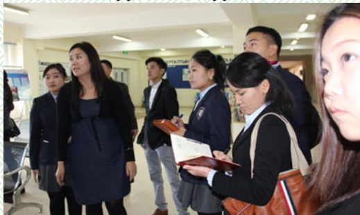
Цогтцэций сумын Мөрөөдөл сургуультай танилцав

“Хоггүй хот –хүүхэд биднээс” уриан дор хагас жилд нэг удаа их цэвэрлэгээ зохион байгуулах ажлуудыг санаачлан, зохион байгуулаад байна.