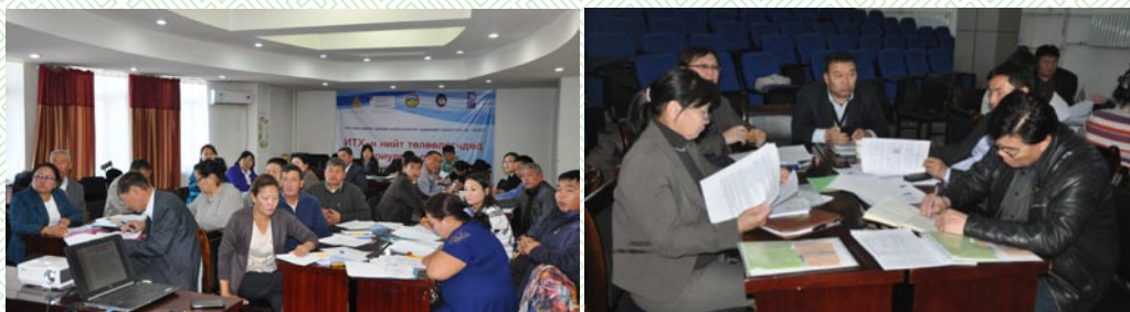
Аймаг, сумдын ИТХ-ын Төлөөлөгчдийн сургалт-2013 он

Улсын Их Хурлын Тамгын газар, НҮБХХ, Швейцарын хөгжлийн агентлаг, Аймгийн ИТХ хамтран Төлөөлөгчийн эрх үүрэг, ИТХ-ын дотоод зохион байгуулалт, төсөв санхүү, авилга, ашиг сонирхолын зөрчлөөс сэргийлэх, байгаль орчин, хүний эрх, иргэдийн оролцоо зэрэг сэдвүүдээр 15 сумын ИТХ-ын 324 Төлөөлөгчдөд сургалт зохион байгууллаа.