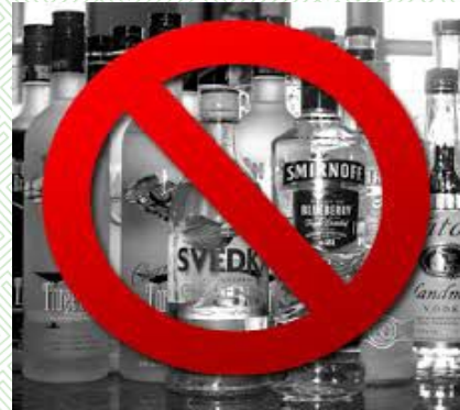
Гэнэтийн шалгалт арга хэмжээ-2014 он

Архигүй Өмнөговь хөтөлбөрийн хүрээнд согтууруулах ундаа худалдах, хэрэглэх, түүгээр үйлчлэх цэгүүдэд хяналт шалгалт хийж нийт 20 аж ахуй нэгжүүдийн согтууруулах ундаа худалдах, түүгээр үйлчлэх тусгай зөвшөөрлийг түтгэлзүүлэн, 23 аж ахуй нэгжүүдийн тусгай зөвшөөрлийг хүчингүй болгосон байна.