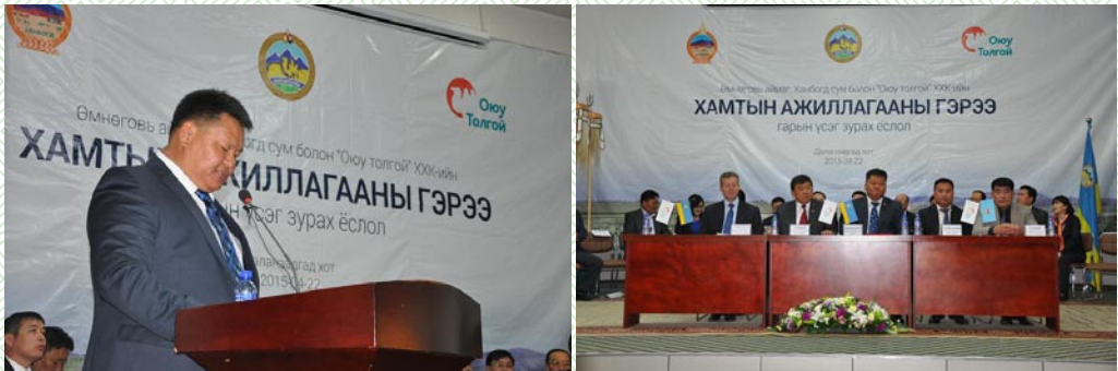
/Өмнөговь аймаг-Оюу Толгой ХХК-ний хамтын ажиллагааны гэрээ/

Өмнөговь аймаг “Оюу толгой” ХХК-тай байгуулах гэрээний талаар Тэргүүлэгчид хэлэлцэж, Өмнөговь аймаг, Оюу толгой ХХК-ний хамтран ажиллах гэрээнд заасан Хөгжлийг дэмжих сангийн удирдах зөвлөлд ажиллах орон нутгийн төлөөллийн бүрэлдэхүүнийг томилон, Харилцааны хороог ажиллуулах талаар аймгийн Засаг даргад үүрэг өглөө.