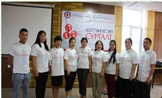
Хүүхэд залуучуудын хөтөлбөрийн сургалт