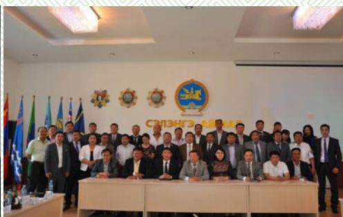
Өмнөговь аймаг-2014 оны 09 сар

Аймгийн ИТХ-ын байнгын тасралтгүй үйл ажиллагааг хангах үүрэг бүхий Тэргүүлэгчид өөрийн бүрэн эрхийн хүрээнд хэлэлцэн шийдвэрлэсэн асуудлуудаар улирал бүр тогтоолын эмхтгэл гарган Төлөөлөгчдөд хүргүүлэн ажиллаж байгаа бөгөөд УИХ-ын Тамгын газар, НҮБ-ын хөгжлийн хөтөлбөр, Швейцарийн хөгжлийн агентлагаас хэрэгжүүлж буй төслийн хүрээнд аймаг, сумдын ИТХ-ын портал, интерактив цахим хуудастай болгож, цахим хуудсаар дамжуулан үйл ажиллагаагаа сурталчилж байна.