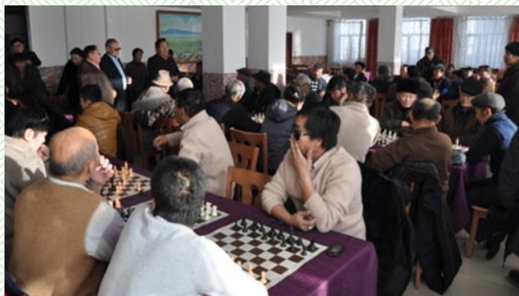
Аймгийн аварга шалгаруулах шатрын тэмцээн