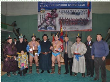
Үндэсний бөхийн барилдаан

Монгол улсад ардчилсан шинэ Үндсэн хууль батлагдсан өдрийг тохиолдуулан Үндсэн хууль батлагдсан өдрийг иргэдэд сурталчлах, хуулиа дээдлэх үзлийг төлөвшүүлэх зорилгоор Үндэсний бөхийн барилдаан, аймгийн аварга шалгаруулах шатрын тэмцээн, аймгийн Иргэдийн Төлөөлөгчдийн Хурлын нэрэмжит гар бөмбөгийн тэмцээн, Ерөнхий боловсролын сургуулийн ахлах ангийн сурагчдын дунд илтгэл, эссэ бичлэгийн уралдаан зохион байгуулж, Шинэ үндсэн хуулийг батлахад аймаг орон нутгаа төлөөлөн оролцсон ахмад депутатуудад хүндэтгэл үзүүлэх арга хэмжээ уламжлал болон амжилттай зохион байгуулагдаж байна.