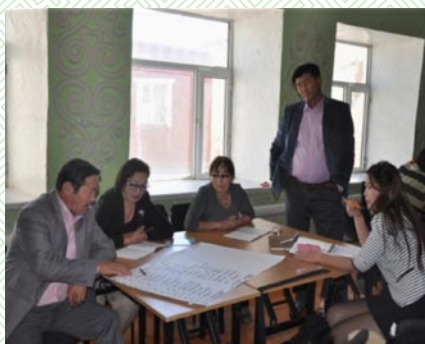
Цогтцэций сум-2014 он

Мерси Кор ОУБ-ын санхүүжилтээр Монголын Нутгийн удирдлагын холбоотой хамтран сумын мастер төлөвлөгөө боловсруулах арга зүйн сургалтыг Гурвантэс, Манлай, Ханбогд, Ханхонгор, Сэврэй, Цогтцэций сумдыг хамруулан зохион байгуулж мастер төлөвлөгөө боловсруулах ажил хийгдсэн ба зарим сумдын ИТХ Төлөөлөгчдөө Удирдлагын академи болон Нутгийн удирдлагын холбооны сургалтанд хамруулаад байна.