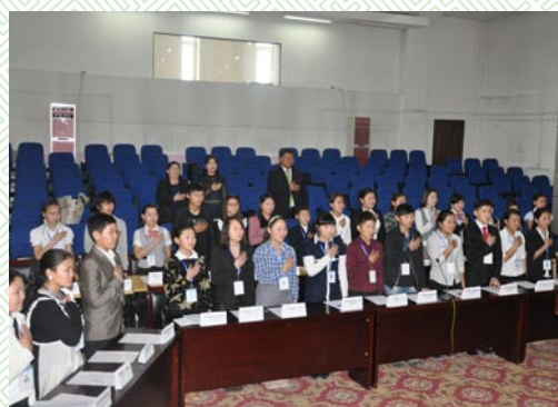
Мини парламентын хуралдаан

Мөн Өмнөговь аймгийн сурагчдын чуулга уулзалт зохион байгуулах, ЕБСургууль болон Политехник коллежийн нийт сурагчдыг хамруулан