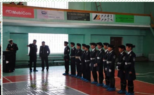
Иргэн ба хууль-11, Ногоон гэрэл, цагаан шугам-2014 он