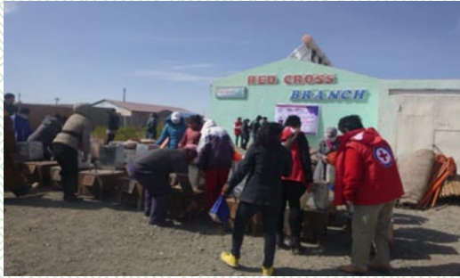
Нийгмийн халамж хөтөлбөрийн тусламж

улаан загалмай, Мэдээлэл сурталчилгаа гэсэн хөтөлбөрүүд, “Залуучууд хөдөлгөөнт болон эрсдэлт бүлгийн хүн амыг БЗДХ/ХДХВ-ийн халдвараас сэргийлэх”, “Гамшгийн эрсдэлийг бууруулах олон нийтийн чадавхийг бэхжүүлэх” зэрэг томоохон төслүүдийг хэрэгжүүлж ажиллалаа.