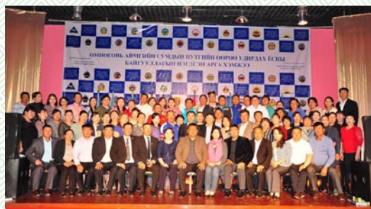
Нэгдсэн арга хэмжээ, Баян-Овоо сум-2015 он