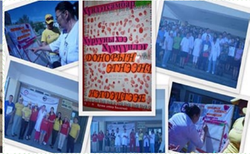
Эрүүл мэндийн хөтөлбөрийн сургалт

Аймгийн Улаанзагалмайн хорооноос хэрэгжүүлдэг 4 үндсэн хөтөлбөрийн хүрээнд 2013-2015 онд хамрагдсан иргэдийн тоог хүснэгтээр харуулбал: