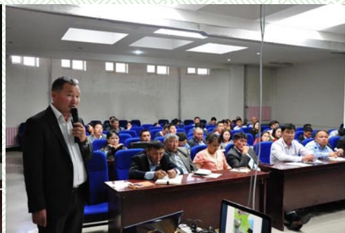
/Байгаль орчны эсрэг гэмт хэргээс урьдчилан сэргийлэх зөвлөгөөн-2015 он/

Мөн нутаг дэвсгэр хариуцсан цагдаагийн байгууллагын үйл ажиллагаанд олон нийтийн хяналт тавих үүрэг бүхий 5 хүний бүрэлдэхүүнтэй “Иргэний зөвлөл”-ийг аймгийн ИТХ-ын дэргэд байгуулан ажиллуулж, зөвлөлийн хагас жилийн ажлын тайланг Тэргүүлэгчдийн хурлаар хэлэлцэв.