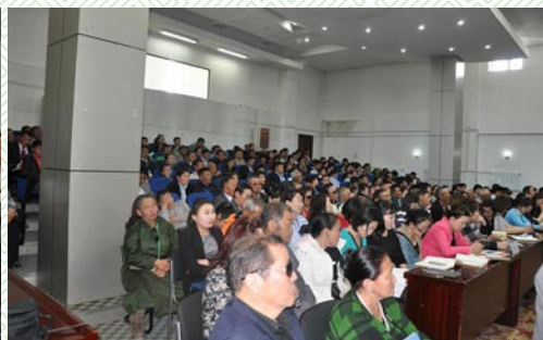
Иргэний танхимын хэлэлцүүлэг-2013 он