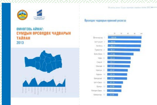
Сумдын өрсөлдөх чадварын тайлангийн ном

Аймгуудын өрсөлдөх чадварын судалгаагаар Өмнөговь аймаг нь 2013 онд 21 аймгаас Орхон аймгийн дараа 2 дугаарт эрэмблэгдсэн. Үүнээс үүдэн аймгийн Иргэдийн Төлөөлөгчдийн Хурлын даргын санаачлагаар аймгийнхаа 15 сумын өрсөлдөх чадварын судалгааг хийлгэн, сумдууд эдийн засаг, засаглалын үр ашиг, бизнесийн үр ашиг, дэд бүтэц гэсэн үндсэн үзүүлэлтүүдээ сайжруулах боломжтой болоод байна.