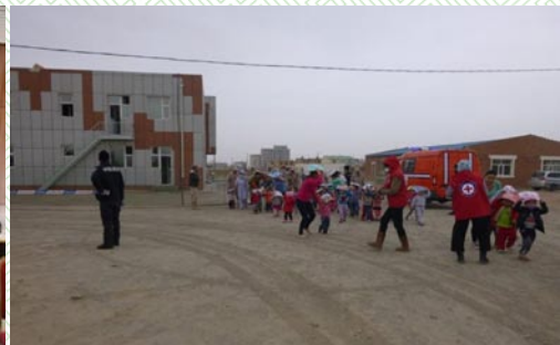
Гамшгийн менежментийн хөтөлбөрийн сургалт

Аймгийн Иргэдийн Төлөөлөгчдийн Хурлын Тэргүүлэгчид Улаан загалмайн хүмүүнлэгийн үйлсийг бусдад уриалан манлайлж, хүмүүнлэгийн хөтөлбөрт нэгдэн хандив өгч, “Улаан загалмайн Онцгой гишүүн”-ээр элслээ.