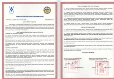
Хүний эрхийн үндэсний комиссттой хамтран ажиллах санамж бичигт гарын үсэг зурав-2014 он

Орон нутгийн өөрөө удирдах ёсны байгууллагаболонзахиргааныбайгууллагын шийдвэрт иргэдийн байр суурь, үзэл бодлыг тусгах, иргэдийн санал бодлыг дээд шатны шийдвэр гаргагчдад сонгох, олон нийтийн санаа зовоож буй асуудлаар нээлттэй