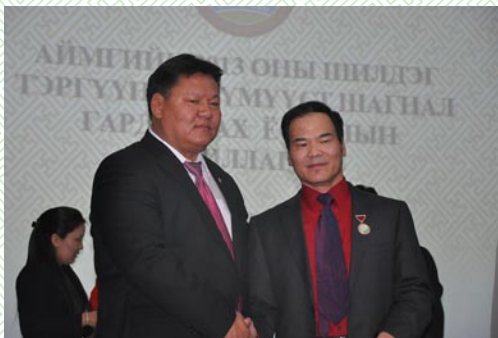
/Төрийн шагнал гардуулае-2013 он/

Мөн 6 хүүхэд төрүүлж, өсгөсөн 155 эх “Эхийн алдар-1”, 4 болон түүнээс дээш хүүхэд төрүүлж өсгөсөн 425 эх “Эхийн алдар-2” одонгоор тус тус шагнагдлаа.