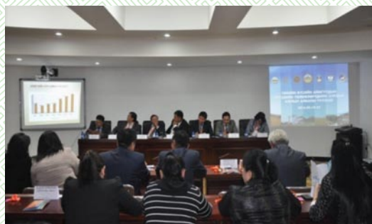
Сэлэнгэ аймаг-2015 оны 06 сар

Төвийн бүсийн аймгуудын иргэдийн Төлөөлөгчдийн Хурлын Тэргүүлэгчид, ажлын албаны ажилтнуудын туршлага солилцох уулзалт Дорноговь, Өмнөговь, Сэлэнгэ, Дархан, Дундговь аймгуудад зохион байгуулагдаж, харилцан туршлага судлаж, мэдээлэл солилцон, МУ-ын засаг захиргаа нутаг дэвсгэрийн нэгж, түүний удирдлагын тухай хууль, сонгуулийн нэгдсэн хуулиудын төсөлд санал боловсруулан нэгтгэж Монгол Улсын Их хурал, Засгийн газар болон Нутгийн удирдлагын холбооны 20 жилийн ойн нэгдсэн зөвлөгөөнд саналаа хүргүүллээ.