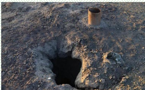
Ажлын хэсэг ноён Гурвантэс сумдад ажиллав-2013 он

Түүнчлэн аймгийн ИТХ-ын дарга, Тэргүүлэгчид аймгийн цэвэр усны нөөц болох Балгасан голын улаан нуурын талбайд “Пибоди винсвэй ресорсез”