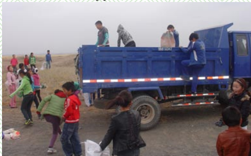
“Хоггүй хот-хүүхэд биднээс” их цэвэрлэгээ

Аймгуудын өрсөлдөх чадварын судалгаагаар Өмнөговь аймаг нь 2013 онд 21 аймгаас Орхон аймгийн дараа 2 дугаарт эрэмблэгдсэн. Үүнээс үүдэн аймгийн Иргэдийн Төлөөлөгчдийн Хурлын даргын санаачлагаар аймгийнхаа 15 сумын өрсөлдөх чадварын судалгааг хийлгэн, сумдууд эдийн засаг, засаглалын үр ашиг, бизнесийн үр ашиг, дэд бүтэц гэсэн үндсэн үзүүлэлтүүдээ сайжруулах боломжтой болоод байна.