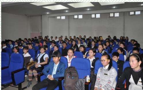
Хүүхдээ сонсоё арга хэмжээ-2013 он

Мини парламентын хуралдаанаар дарга, нарийн бичгийн даргыг сонгон томилж, гишүүдийг Нийгмийн бодлого, Ёс зүй, Урлаг, спорт, Мэдээлэл сурталчилгаа, Байгаль орчин гэсэн 5 хороонд хуваарилан, салбар тус бүрт тулгамдаж байгаа асуудлуудыг хэлэлцэн, шийдвэрлэх арга замыг аймгийн ИТХ-ын Тэргүүлэгчдэд танилцуулан ажиллаж, холбогдох албан байгууллагуудад саналыг хүргүүлээ.