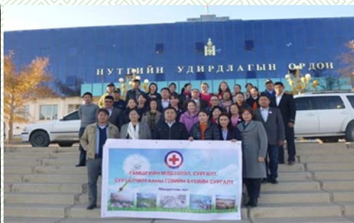
Улаан загалмайн говийн бүсийн сургалт

Аймгийн Улаан загалмайн хороо нь Эрүүл мэндийг дэмжих, Нийгмийн халамж, Хүүхэд залуучууд, Гамшгийн менежмент гэсэн 4 үндсэн хөтөлбөрийн хүрээнд үйл ажиллагаагаа явуулж, 2012-2015 онд Хүмүүнлэг, Эрүүл мэндийн анхны тусламжийн, БЗДХ, ХДХВ, ДОХ-той тэмцэх, Донор сурталчилгаа, Гамшгийн бэлэн байдал, Халамж үйлчилгээний, Залуучуудын