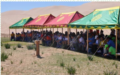
Сургалт, Сэврэй-2014 он