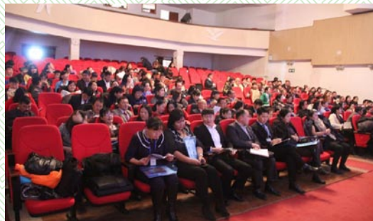
Дорноговь аймаг-2013 он

зохицуулах, ашиг сонирхлын зөрчлөөс урьдчилан сэргийлэх тухай хууль, түүнчлэн мэдүүлгийг бүрдүүлэлтийн цахим программ хангамжийн талаарх сургалтанд аймаг сумдын ИТХ-ын Тэргүүлэгчдийн нарийн бичгийн дарга, ЗДТГ-ын дарга, зарим агентлагийн эрх бүхий албан тушалтнууд хамрагдсан болно.