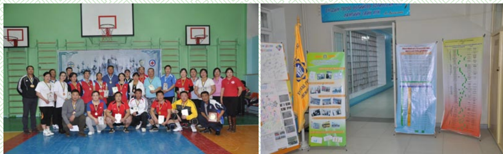
Монгол бахархалын өдөрт зориулсан арга хэмжээ-2014 он

2014 оны Монгол бахархалын өдрөөр аймгийн Гэмт хэргээс урьдчилан сэргийлэх ажлыг зохицуулах зөвлөл, Улаан загалмайн хороо хамтран гэмт хэрэг зөрчлөөс урьдчилан сэргийлэх, хүмүүнлэгийн үйл ажиллагааг сурталчлах, туршлага солилцох, ажлын хүрээнд төрийн байгууллага, агентлагуудын дарга, удирдлагуудын дунд гар бөмбөг, сагсан бөмбөг, дартс шидэлтийн төрлүүдээр нөхөрсөг тэмцээнийг зохион байгуулж, улаан загалмайн хүмүүнлэгийн үйл ажиллагаанд 1,4 сая төгрөгний хандив бүрдүүлэн, гэмт хэргээс урьдчилан сэргийлэх чиглэлээр 14 байгууллага тайлан, туршлагаа танилцууллаа.