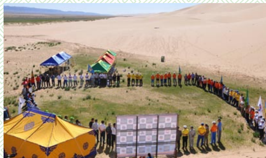
Нэгдсэн арга хэмжээ, Сэврэй-2014 он