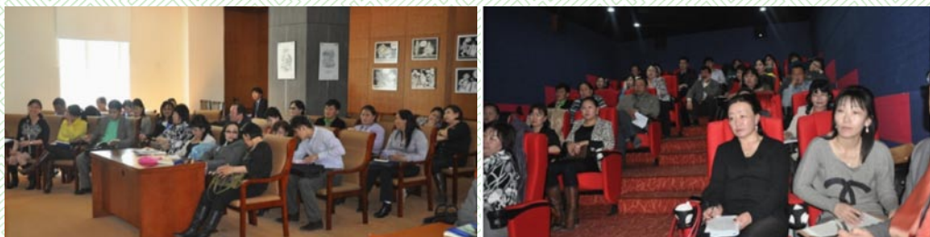
/Сумдын ИТХ-ын Тэргүүлэгчдийн нарийн бичгийн дарга нарын сургалт/

Төсвийн шинэ хууль, “Шууд ардчилал-Иргэдийн оролцоо” сэдэвт сургалтанд аймаг, сумын ИТХ-ын дарга, Тэргүүлэгчдийн нарийн бичгийн дарга нар хамрагдлаа.