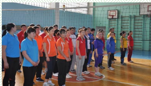
Төрийн албан хаагчдын дунд гар бөмбөгийн тэмцээн