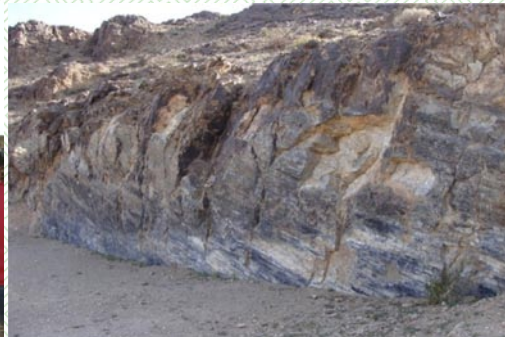
Орон нутгийн тусгай хамгаалалтад авсан зарим газрыг нягтлан судлах ажлын хэсэг-2013 он/

Түүнчлэн гэмт хэрэг, зөрчлөөс урьдчилан сэргийлэх, нийтийн хэв журам хамгаалах ажилд олон нийтийн цагдаагийн ажилтан ажиллуулах зорилгоор аймгийн хэмжээнд ажиллах олон нийтийн цагдаагийн ажилтны тоог 24 байхаар батлаж, үйл ажиллагааг нь эхлүүлээд байна.