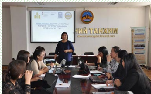
Аймгийн Иргэний танхим-2014 он