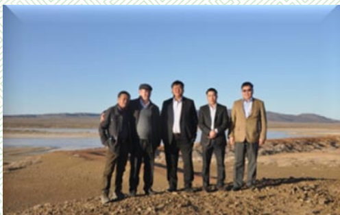
Тэргүүлэгчид Балгасан голын улаан нуурын орчимд-2014 он