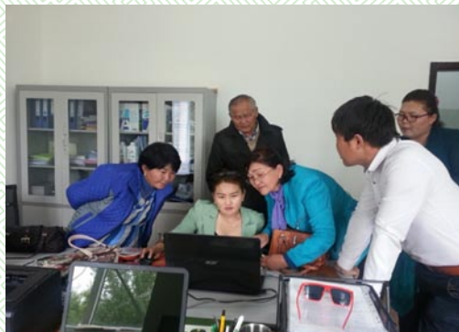
/Шилэн дансны хуулийн хэрэгжилт шалгах ажлын хэсэг-2015 он/

Байгаль орчны эсрэг гэмт хэргийн асуудлаар 15 сумын ИТХ-ын дарга, байгаль хамгаалагч, байгаль орчны байцаагч нарыг хамруулсан зөвлөгөөн зохион байгуулж, зөвлөгөөнөөс гарсан саналуудыг Тэргүүлэгчдийн хурлаар хэлэлцэн холбогдох газруудад үүрэг, чиглэл хүргүүлсэн.