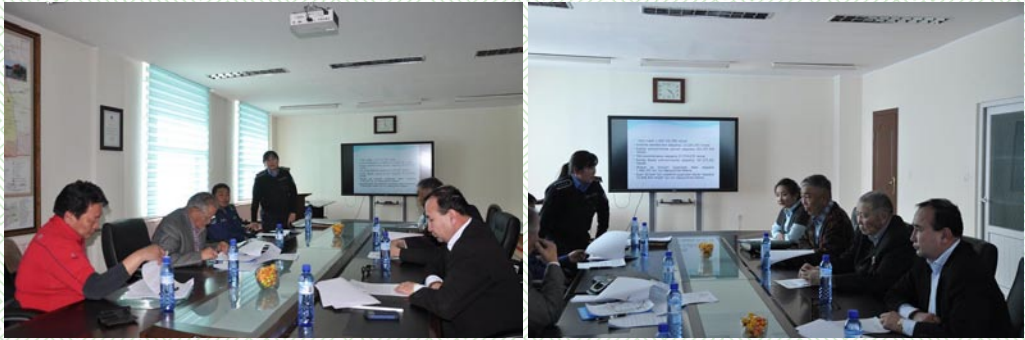
/Иргэний зөвлөлийн хурал-2015 он/

Өмнөговь аймаг “Оюу толгой” ХХК-тай байгуулах гэрээний талаар Тэргүүлэгчид хэлэлцэж, Өмнөговь аймаг, Оюу толгой ХХК-ний хамтран ажиллах гэрээнд заасан Хөгжлийг дэмжих сангийн удирдах зөвлөлд ажиллах орон нутгийн төлөөллийн бүрэлдэхүүнийг томилон, Харилцааны хороог ажиллуулах талаар аймгийн Засаг даргад үүрэг өглөө.