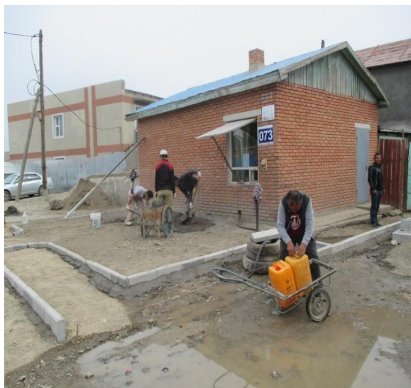
166 дугаар худгийн гадна талд тохижилт хийгдсэн байгаа байдал