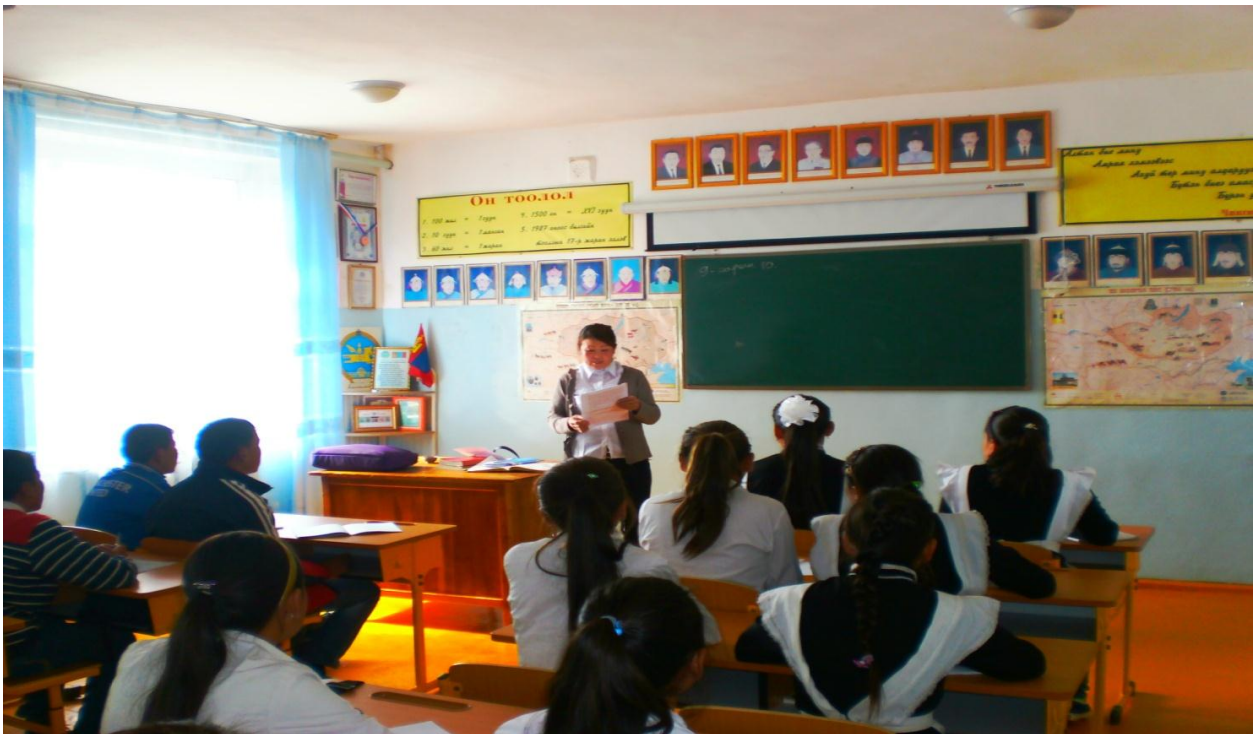
Давст сумын ИТХ-ийн НБДарга Ичинхорлоо дурсгалын хилээл заав

Хичээлийг аймгийн боловсрол соёлын газраар дамжуулан Увс аймгийн арван жилийн бүх сургуулийн ахлах ангийн сурагчдад 09-р сарын 5-9 ны хооронд тусгай боловсруулсан хөтөлбөрөөр түүхийн багш нар хичээл заав. Уг хичээлд нийт ахлах ангийн сурагчид маш идэвхтэй оролцсон ба зарим сумуудын ИТХ-ийн нарийн бичгийн дарга нар өөрсдөө хичээлийг удирдан явуулсан байна. Дурсгалийн хичээлд ахлах ангийн 180 бүлгийн нийт 4600 сурагчид хамрагдсан байна.