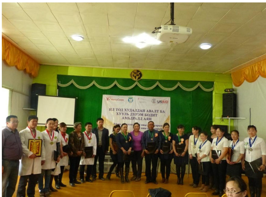
“Элсэн цаг” тэмцээнд тэргүүн байр эзэлсэн багууд